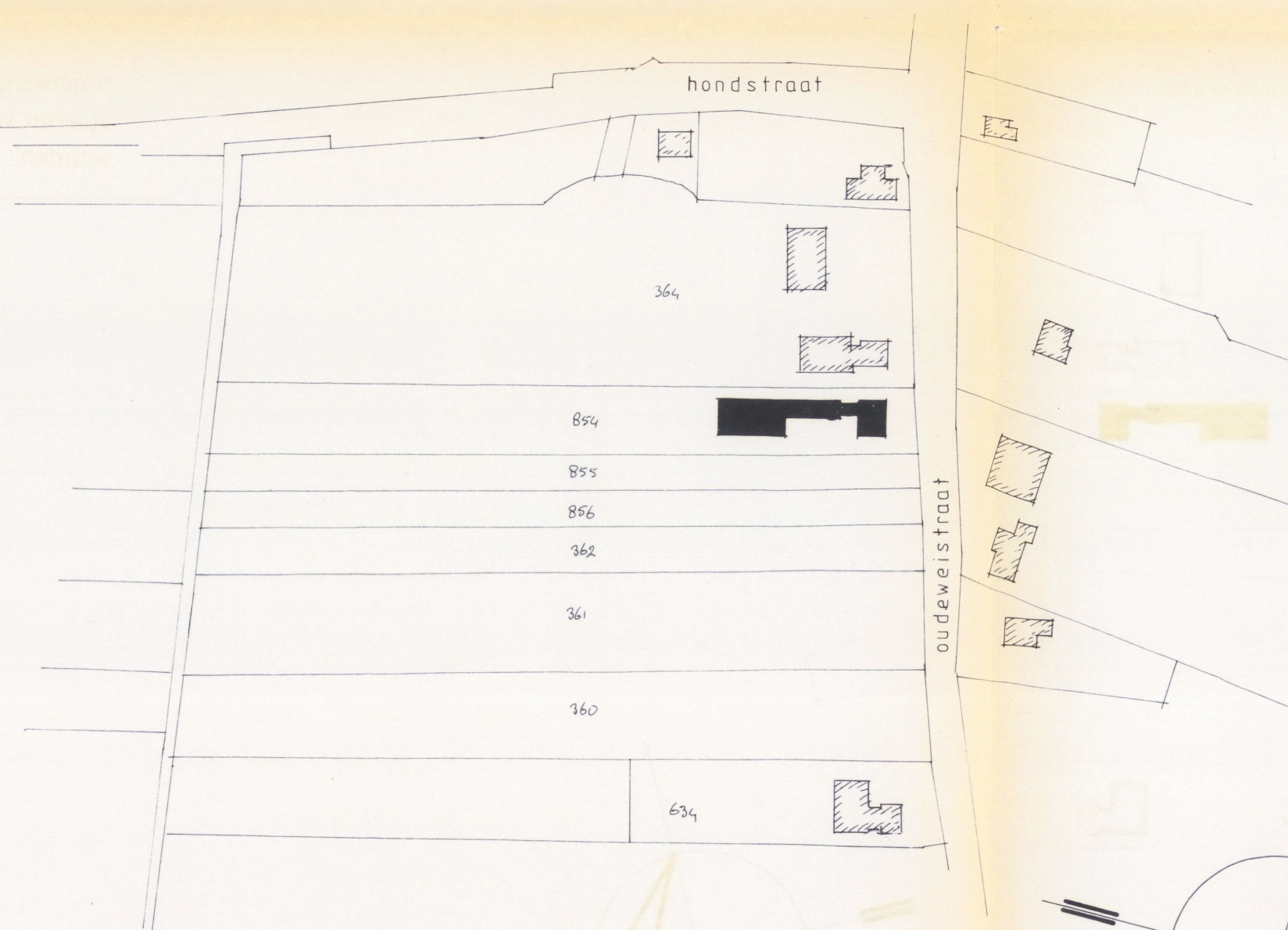
kad. gemeente Maasdriel, sectie M6, nr. 854 SCHAAL 1:2000